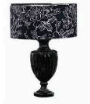
Blumarine Home Collection