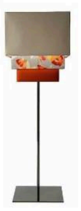
Kenzo Home Collection