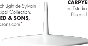
Lámpara, Skan, de Liévore, Altherr, Molina, VIBIA , vibia.es*