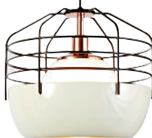
Lámpara, Trunk, DIMA LOGINOFF , dimaloginoff.com*