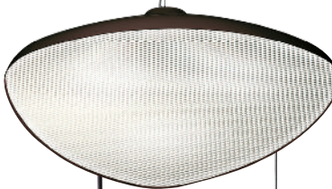
Lámpara, Treis de Benjamin Hubert KUNDALINI , benjaminhubert.com*