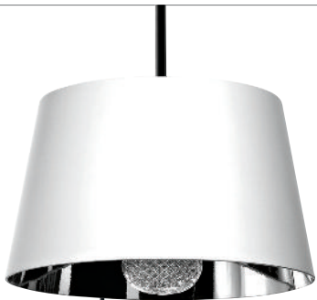
Lámpara, Mistral, MOOOI , disponible en Studio Roca, Ámsterdam 271, Condesa, studioroca.com*