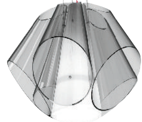
Lámpara, We are all made of stars, Damien Langlois-Meurinne, SE COLLECTION I , se-london.com*