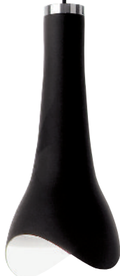
Lámpara, Maki de Nendo, FOSCARINI , nendo.jp*