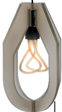
Lámpara, Conciencia, DIEZ , disponible en Blend, Palmas 520, Lomas de Chapultepec.*