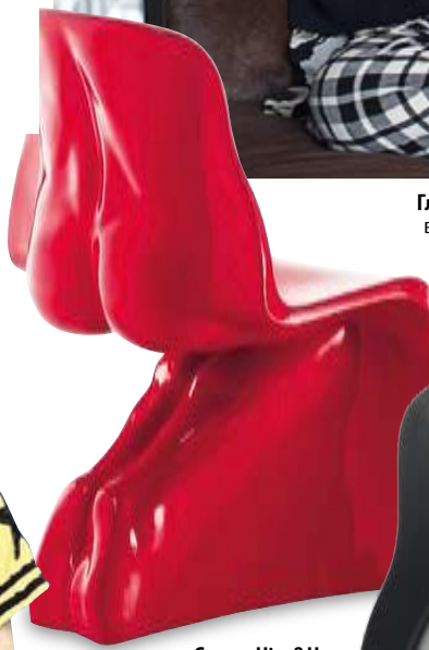
Стулья Him & Her, Casamania. Дизайнер Фабио Новембре поведал миру историю любви и страсти на языке... стульев.