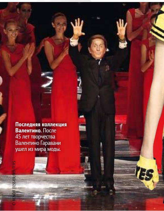
Последняя коллекция Валентино. После 45 лет творчества Валентино Гаравани ушел из мира моды.