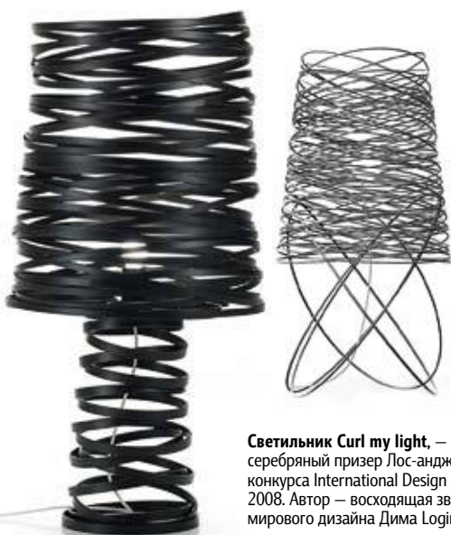
Светильник Curl my light, — серебряный призер Лос-анджелесского конкурса International Design Awards 2008. Автор — восходящая звезда мирового дизайна Дима Loginoff.