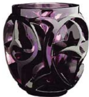
Легендарная ваза Lalique Tourbillons по заказу модного дома Patrick Hellmann вышла ограниченным тиражом в фиолетовом цвете.